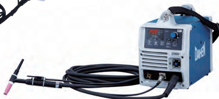
デジタルティグミニ 200P