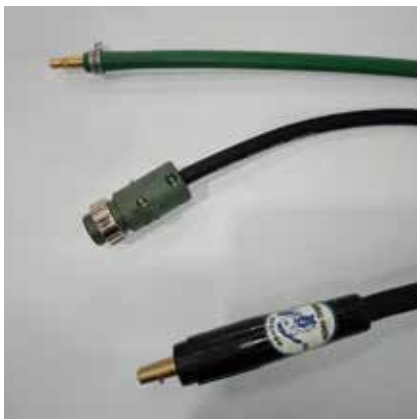
日東22PH 6Pプラグ ジョイントJA300/500オス