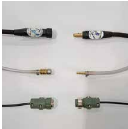
ジョイントJA300メス 日東22SH 2P中断用 ジョイントJA300オス 日東22PH 2Pプラグ