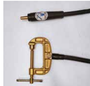
ジョイントJA500オス クリップEB500