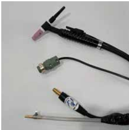
日東22PH 2Pプラグ ジョイントJA300オス