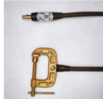
ジョイントJA300オス クリップEB300