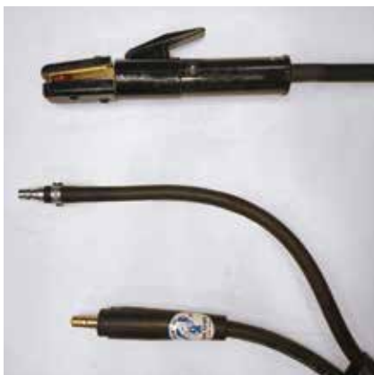
ジョイントJA500オス カブラ日東30PHオス