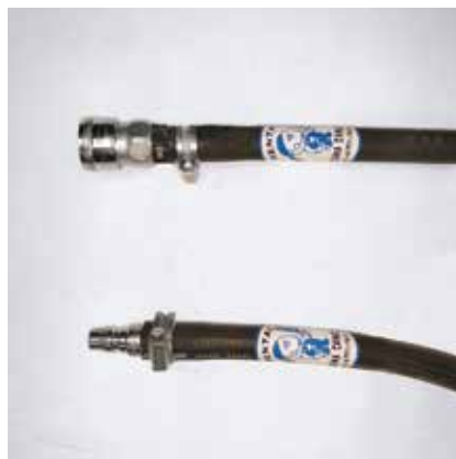
カブラ日東30SH カブラ日東30PH