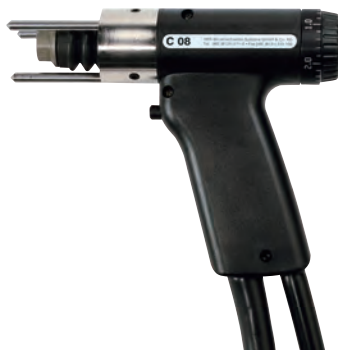
C-08 [コンタクト式] 鉄・ステンレス用 ケーブル長さ:6.5m