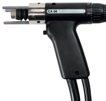
CA-08 [リフトアップ式] アルミ用 ケーブル長さ:3m