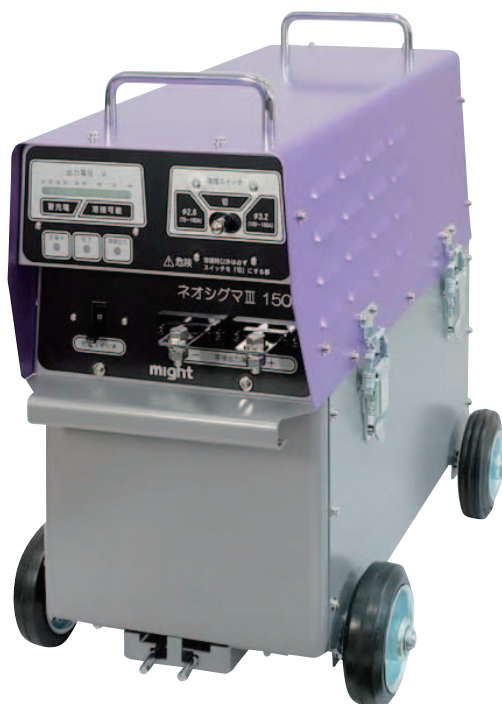
ネオシグマ III 150