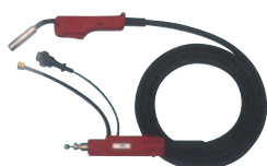
YT-35CS4, CSM4, CSL4

CS4適用ワイヤ径(0.9) 1.2mm CSM4適用ワイヤ径(0.9) 1.2mm CSL4適用ワイヤ径1.2mm