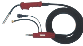
YT-50CS4, CSM4, CSL4

CS4適用ワイヤ径(0.9) 1.2mm CSM4適用ワイヤ径(0.9) 1.2mm CSL4適用ワイヤ径1.2mm