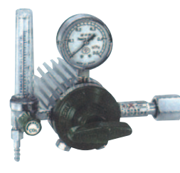
ノーヒーター調整器