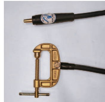
ジョイントJA500オス クリップEB500