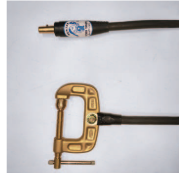
ジョイントJA300オス クリップEB300