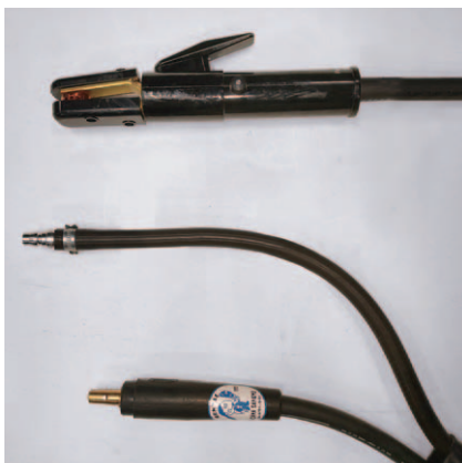
ジョイントJA500オス カブラ日東30PHオス