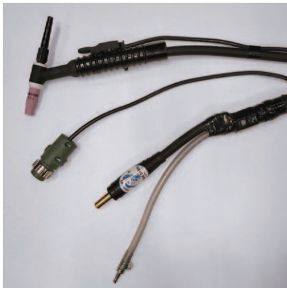
ヤマトPA-1オス 2Pプラグ ジョイントJA300オス