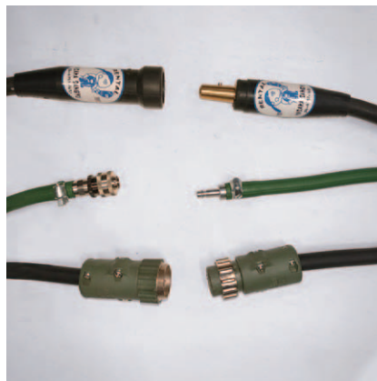
ジョイントJA500メス ヤマトSA-1メス 6P中断用 ジョイントJA300オス ヤマトSA-1オス 6Pプラグ