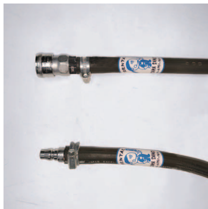
カブラ日東30SH カブラ日東30PH