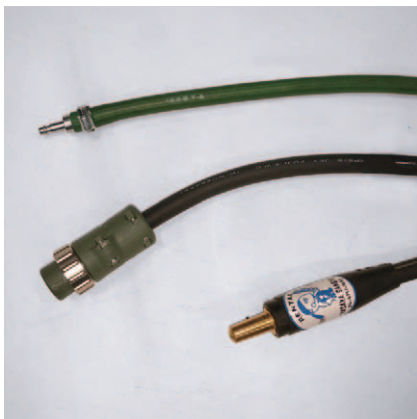
ヤマトPA-1オス 6Pプラグ ジョイントJA500オス